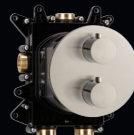
17.500550.1.09 17.503050.1.09 / 17.503055.1.09 iX Unterputz-Thermostate round