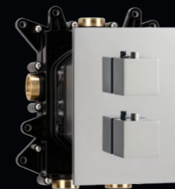
11.500550.2.01 11.503050.2.01 / 11.503055.2.01 Unterputz-Thermostate square