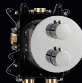
11.500550.1.01 11.503050.1.01 / 11.503055.1.01 Unterputz-Thermostate round