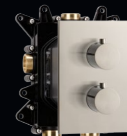
17.500550.2.09 17.503050.2.09 / 17.503055.2.09 iX Unterputz-Thermostate square