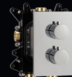
11.500550.3.01 11.503050.3.01 / 11.503055.3.01 Unterputz-Thermostate square