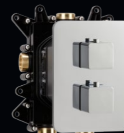
11.500550.4.01 11.503050.4.01 / 11.503055.4.01 Unterputz-Thermostate soft